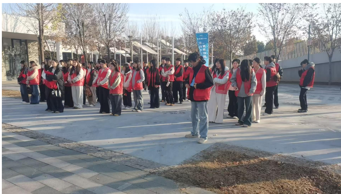
去示范区做志愿服务

论宣讲、垃圾分类知识、文明养狗行为宣讲、宪法思想宣传等主题宣讲近 50 场，进一步提升我校师生和社区居民的文明素养。