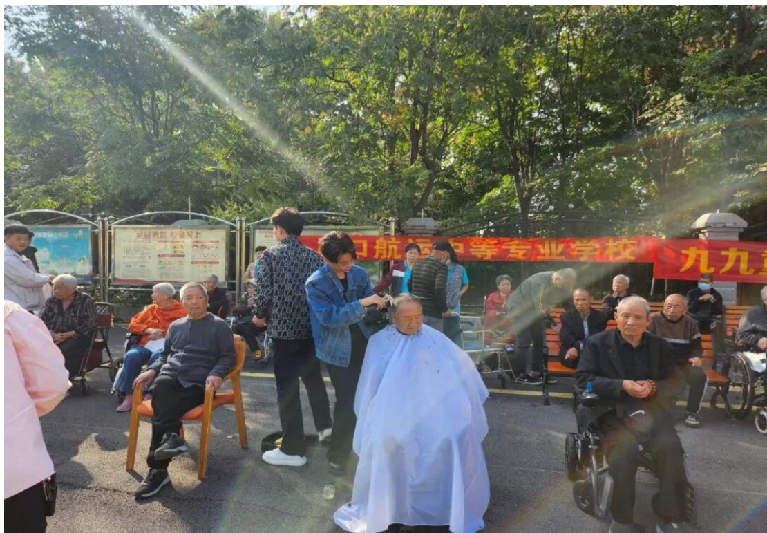
到敬老院做义剪活动