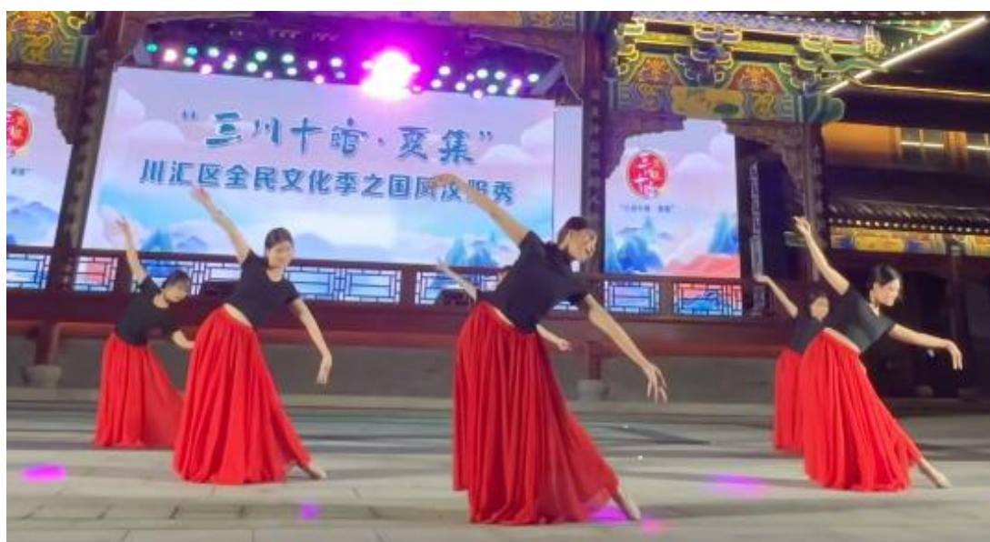
去川汇区全民文化季表演节目